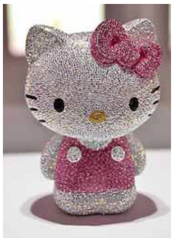
Hello Kitty, uitgevoerd met 19.636 Swarovski steentjes.

Een al jaren lopende discussie is de vraag of Hello Kitty niet heel erg veel lijkt op de twintig jaar eerder ontworpen Nijntje.