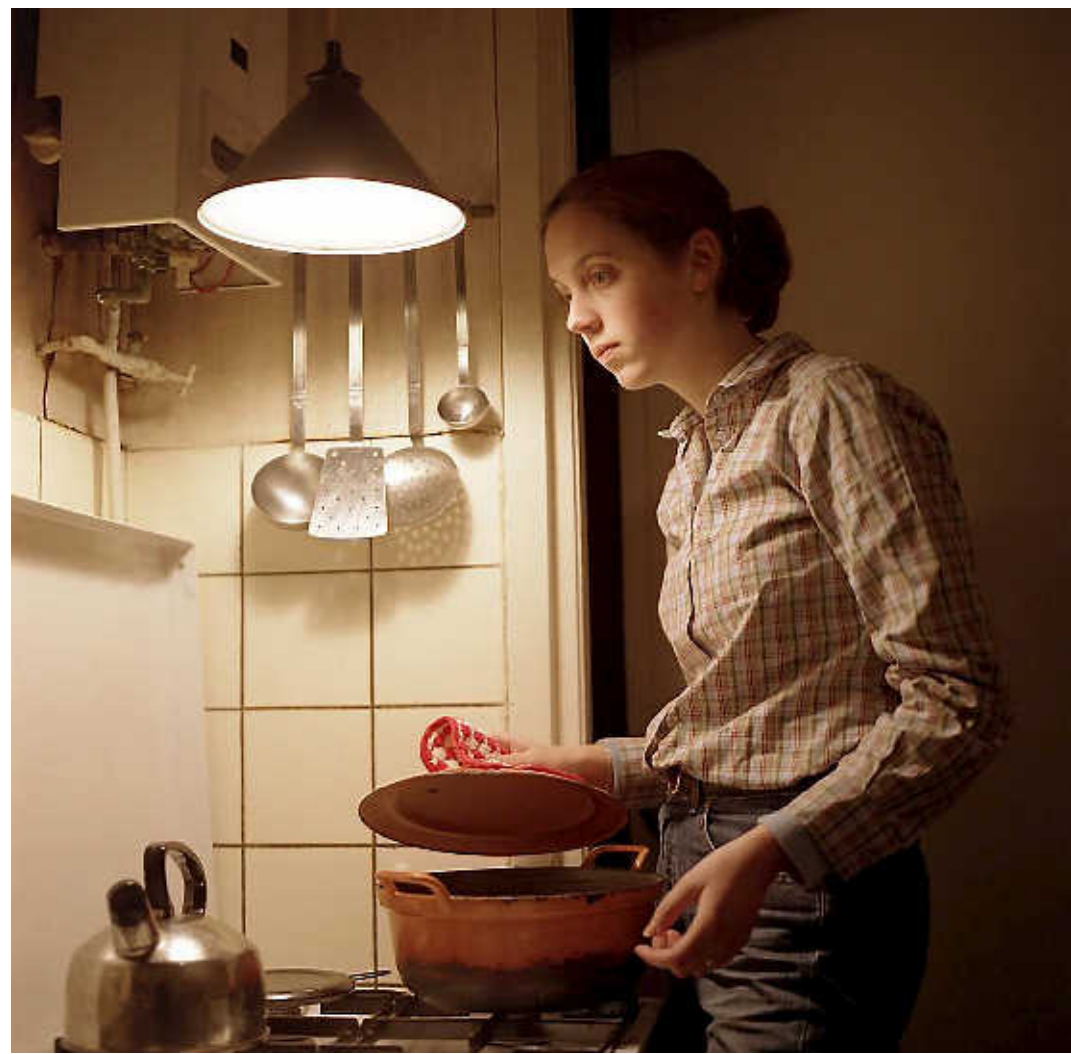
De genomineerde foto 'Huishouding 2'.