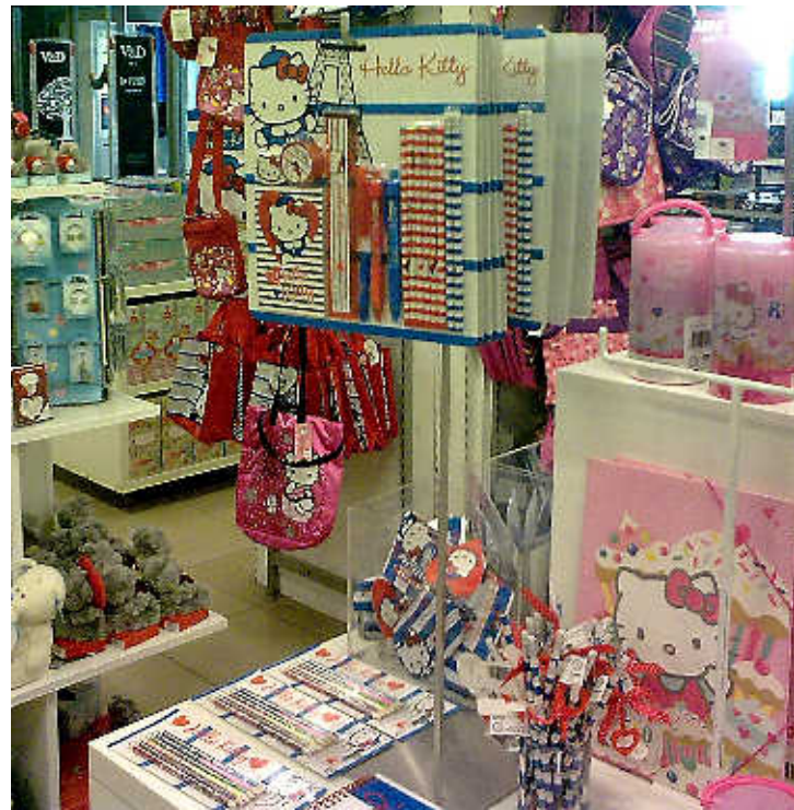
Hello Kitty-hoekje in V&D in Leiden.